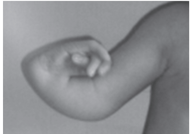
Figura 2. Desviación radial de la mano y ausencia del pulgar