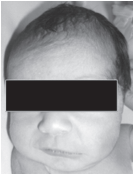
Figura 1. Desviación de la comisura labial hacia la izquierda

alteración ósea en el antebrazo derecho, mala definición del riñón izquierdo y descenso del riñón derecho a la parte alta de la pelvis. Se hizo cesárea a las 36 semanas. Peso al nacimiento: 2.155 g, talla: 48 cm, PC: 33 cm. El examen físico y los estudios dismorfológicos evidenciaron asimetría del tercio inferior de la cara (figura 1), agenesia del radio y el pulgar derechos (figuras 2 y 3), una vértebra en cuña (figura 4) y ectopia renal izquierda cruzada.