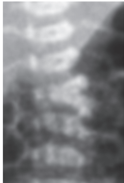
Figura 4. Vértebra en cuña