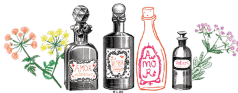
Ilustración y tipografía: Natalia Ayala Pacini

Es mujer, brasilera. Estudiante de antropología, por pasión; estudiante de derecho, por cosas de la vida. En el brazo lleva una cometa que la hace volar. Lady Gaga es su cantante favorita y adora escribir sobre las cotidianidades del mundo.