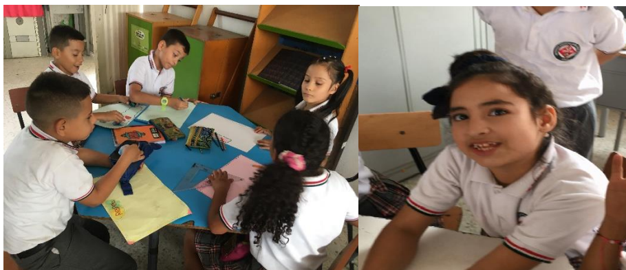
Foto 8 . Actividad ¿Qué valores pongo en práctica en la convivencia escolar?

En la actividad ¿Qué valores pongo en práctica en la convivencia escolar? una estudiante dice “que la tolerancia es querer y respetar a los otros, aunque sean diferentes”, esta respuesta da cuenta de aprendizajes valiosos del grupo que a medida que pasa el tiempo se van estructurando de manera más clara con la implementación de la secuencia didáctica, mediante la práctica con el dibujo y la pintura los estudiantes logran poner en práctica todos estos conceptos, un ejemplo de esto es cuando dibujan niños compartiendo, dialogando para solucionar sus diferencias o disculpándose, es una posibilidad para mostrar en un código distinto sus sentimientos, sus aprendizajes y sus anhelos.