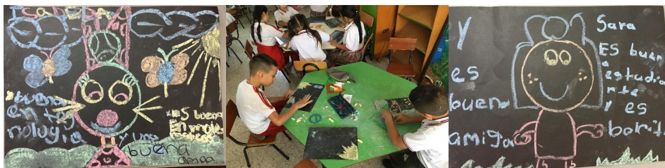
Foto 16 . Actividad ¿Cómo me puedo relacionar con mis compañeros?

Durante la actividad ¿cómo me puedo relacionar?, se ponen de manifiesto las emociones al escribir algo hacia sus compañeros y al recibirlo, se aprovecha esta oportunidad para valorar las cualidades de otros. Las actividades grupales aportan también al conocimiento y manejo de las emociones, pues, para tomar decisiones en equipo es necesario mediar entre las ideas de todos los integrantes y saber manejar la alegría por la propuesta aceptada o la tristeza o frustración por su desaprobación.