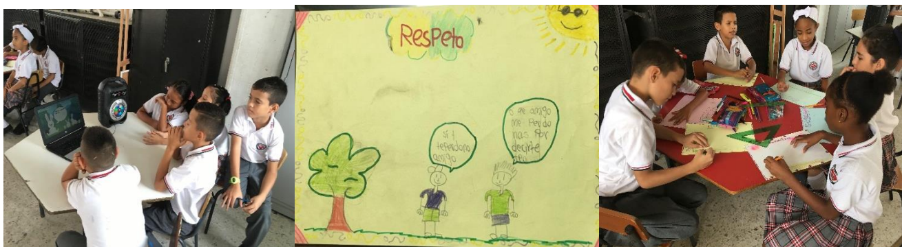
Foto 6 . Actividad ¿Qué valores pongo en práctica en la convivencia escolar?

La práctica de valores entendidos como elementos que “afecta a su conducta, configura y moldea sus ideas y condiciona sus sentimientos” (Carreras, 2009, p.20), es otro aspecto importante para las relaciones interpersonales, cuando se dan relaciones de respeto se crean ambientes propicios para compartir, para interactuar, intercambiar saberes y crear lazos de amistad, todos aspectos necesarios para hacer un manejo de los conflictos y favorecer la convivencia. En la actividad ¿Qué valores pongo en práctica en la convivencia escolar? los estudiantes dieron su opinión sobre valores como el respeto, la tolerancia, la solidaridad y la empatía, al hablar sobre respeto un estudiante dijo “que respeto es no decirle groserías a otro para ser amigos y compartir” aquí se puede concluir que para los estudiantes la amistad es valiosa, al igual que compartir con otros, por ello cobra importancia relacionarse con otros.