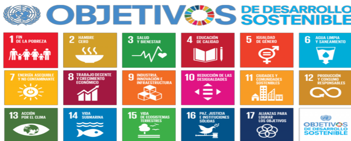
Figura 1. Objetivos de desarrollo sostenible. Copyright 2016 por Programa de las Naciones unidas para el desarrollo.

Algunos de estos Objetivos son: lograr la igualdad entre los géneros, promover el crecimiento económico sostenido, inclusivo y sostenible, el empleo pleno y productivo y el trabajo decente para todos, garantizar también modalidades de consumo y producción sostenibles y la adaptación de medidas para combatir el cambio climático y sus efectos.