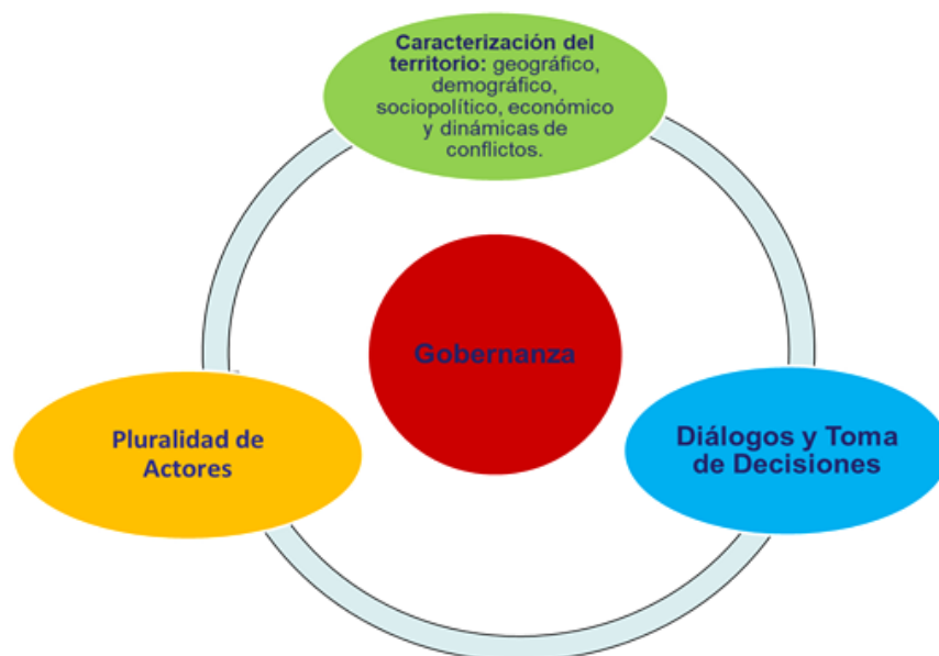
Figura 1. Gobernanza territorial en Buenos Aires-Cauca para afrontar la sustitución del cultivo de uso ilícito de coca

Fuente: Elaboración propia a partir del marco de referencia.