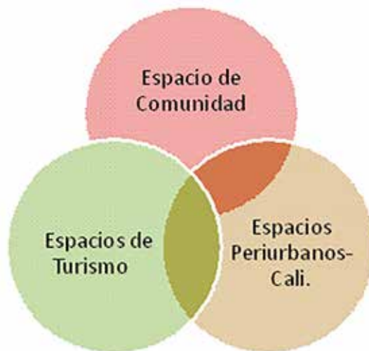
Figura No 3. Espacios de movilidad de los líderes de Pance.