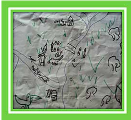
Figura 5. Dibujo realizado por niño de 9 años. Julio de 2013.

“Yo quiero un Pance con árboles y con un el río lleno de peces, otra vez”.