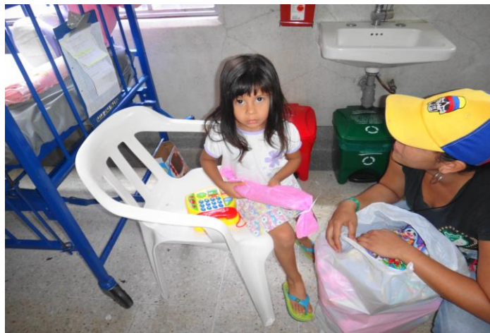
Imagen 10. Campaña social.

Lo anterior ha motivado la creación de estatutos del barrista y la consolidación de proyectos acompañados (alcaldías) como el Barrismo social que motiva a transformar la imagen negativa de los barristas y lograr que el imaginario del público en general se transforme. Campañas como ' Radicales por la sonrisa de un niño ' son la manifestación de este deseo de liberarse de tal imagen nociva: