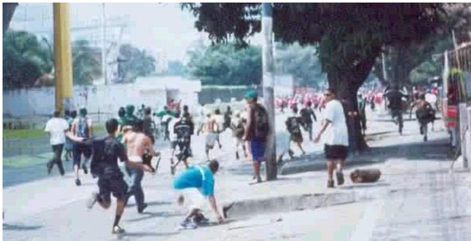
Imagen 7. Desmanes.

De esta respuesta también se puede observar que el carácter de ‘enemigo especial’ no se da a todas las demás barras sino precisamente a las barras que demuestren ser violentas. Haciendo alusión a esa frase que reza: ‘la violencia genera violencia’