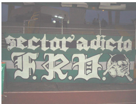
Imagen 5. Trapos.