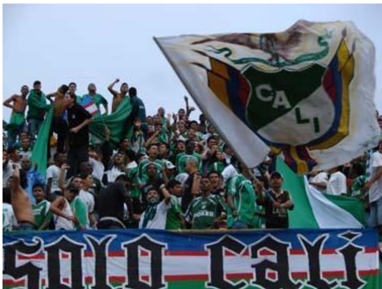
Imagen 6. Decoración de la tribuna.

rudos o violentos, de alguna forma salvajes. Lo que indica el que así lo sea, es que no solo se apoya a un equipo sino que se busca intimidar a simpatizantes del equipo rival. La anterior afirmación es muy interesante porque a la luz de la teoría, estamos diciendo que el campo definido como ese objeto social definido por los objetos en juego; saldría del esquema deportivo al esquema beligerante. El barrista transita dos campos sociales y de representación diferentes: el deportivo y el referente al honor. Es decir, aquí evidenciamos una doble construcción social: el del equipo de fútbol que debe ser alentado por sus virtudes deportivas y el del hincha que representa tal equipo y su capacidad de intimidar (extradeportivo).