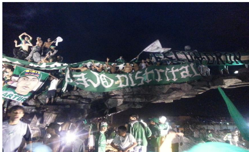
Imagen 3. Celebraciones.