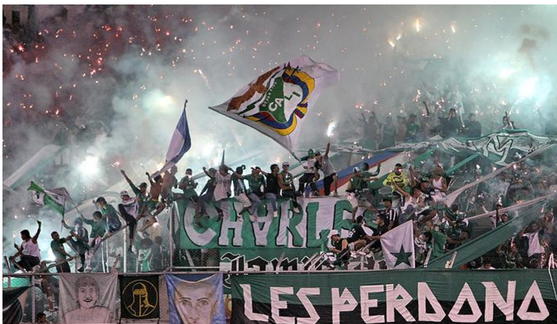
Imagen 4. Recibimientos al equipo.

En la imagen 3 y 4 vemos el carnaval y el ambiente característico de una celebración y un festejo de la hinchada. Se alaba su forma de alentar y siempre se cuenta con el tradicional despliegue de color. En contraste a lo mencionado anteriormente, la celebración trae consigo siempre el desenfreno y la locura: la sobriedad no es una característica de una celebración de barras. Existe por lo tanto una fuerte tendencia a los excesos cuando se celebra un título y en ciertas circunstancias incluso un gol. Podría decirse que la celebración es más bien una manifestación o una exteriorización del conjunto de representaciones de los barristas. Expresa la euforia, el amor y en algunas ocasiones la violencia que constituye su noción del estilo de vida en la barra.