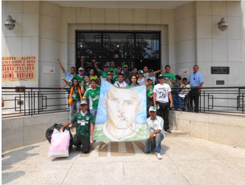
Imagen 2. Retrato de un hincha.

no pierden seres queridos en la defensa de su equipo. De alguna manera el tener que 'llorar a sus muertos', y que esto sea por el ejercicio de apoyar a un equipo de fútbol, da al barrista cierta autoridad, lo que también le da un lugar en la ciudad, lo distingue (sin hacer referencia a que sea buena o mala esta razón de distinción) y caracteriza. Entonces, así como se afirmaba en las ideas de Tomás Ibañez, citado en nuestro marco teórico, las representaciones son como teorías científicas, pero de sentido común, que sirven para explicar y dar significado a los fenómenos cotidianos, así, la violencia y la muerte, con su caracterización en imágenes se enquistan en los idearios de los barristas y se convierten en una parte de la identidad 'ruda' que los acompaña.