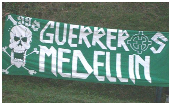
Imagen 4. Trapos.

Para contextualizar el significado de estos trapos veamos una respuesta de un barrista a la pregunta: ¿Cuál es el significado de los trapos en la barra? ¿cuántos trapos tienen? ¿por qué se llaman trapos?