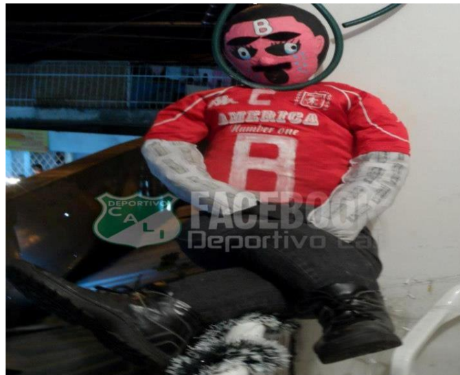
Imagen 8. Elemento para desprestigiar al rival.

Como otro elemento de la identidad del barrista, asociada a las confrontaciones, tenemos que se aporta al capital simbólico de la barra con capacidad de agresión y demostración. Y ahora agregamos la capacidad de creación o creatividad para insultar y ofender al rival: quitándole los trapos, elaborando pancartas y muñecos o caricaturas alusivos a la inferioridad del otro equipo. Por ejemplo como se ve en las siguientes imágenes: