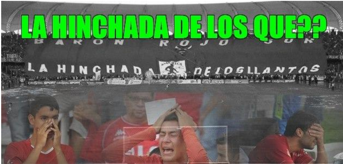
Imagen 9. Ofensa a la barra del América por su descenso. 8

Por todo lo anterior, la manifestación ofensiva hacia el rival y la capacidad de lucha ya sea con éste o la policía, son el elemento más característico en la formación de identidad del barrista del Frente Radical Verde y en general del barrista. Estos elementos configuran una imagen del individuo barrista como el agresivo capaz de transgredir y sin miedo a los enfrentamientos con otros barristas.