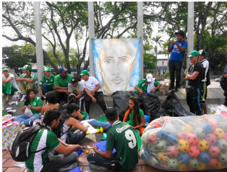
Imagen 1 7 . Costumbres de la barra.

Algunas de las cosas que se mencionan sobre la barra se pueden resumir con imágenes, veamos a continuación algunas: