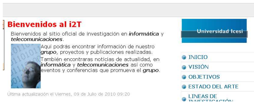
Ilustración 44 – Palabras Claves.